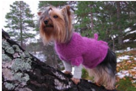
Bildet: Posja i hjemmestrikket ullgenser, laget av en genserarm.

Hvis man har en hund som fryser lett må den kanskje ha klær for å trives ute på kalde vinterdager. Det finnes mye fancy å velge blant i butikkene, men ikke mye som hjelper svært godt. Vi er overbevist om at også hunder vil holde varmen bedre om de kler seg i ull og etter lag på lag prinsippet. Et føret dekken vil etter vår mening ha noe begrenset effekt fordi kald luft