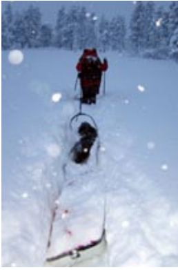
Bildet: For bred pulk blir tung å dra når føret er vanskelig