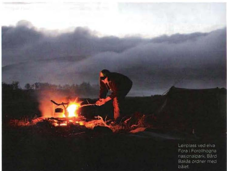
Leirplass ved elva Forå i Forollhogna nasjonalpark. Bård Bakås ordner med bålet.

For mer informasjon, se Norges padleforbunds nettsider, www.padling.no