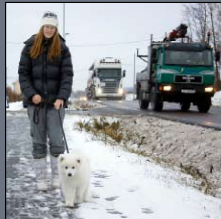
Liten valp som lærer at store biler ikke er farlige

En valp er særlig avhengig av kontakt med mennesker i perioden fra de er 3-12 uker gamle. Hvis den ikke får slik kontakt vil den bli redd mennesker, og det vil være vanskelig å rette opp dette senere. Det finnes ulike studier som konkluderer litt forskjellig, men det kan se ut til at valper lettest sosialiseres på mennesker når de grovt angitt er mellom 3 og 12 uker gamle.