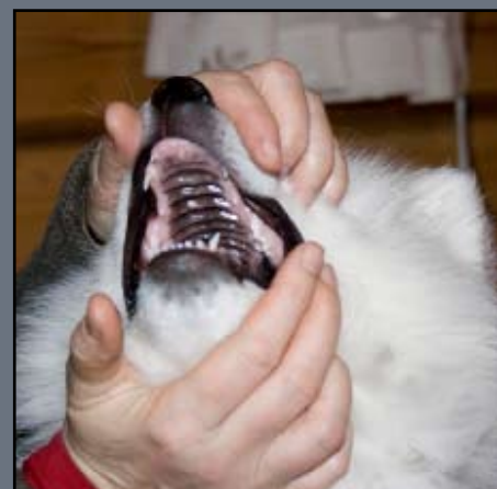
Håndtering er sosial samhandling