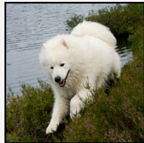
Jeg kommer, mutter'n!!! Innkalling er viktig